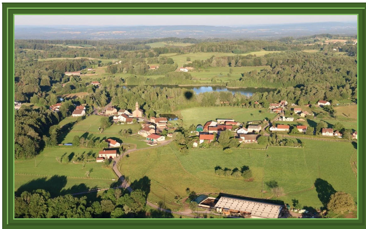
Photo prise depuis une montgolfière juillet 2019